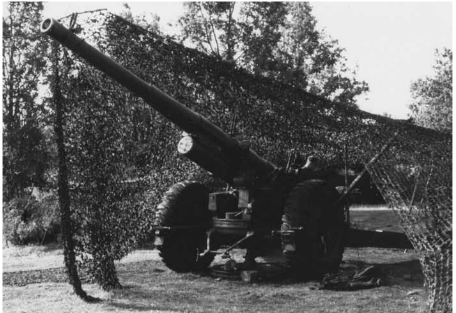
15,2 cm Boforskanon m/37 sköt 23 km och vägde 15 ton

I november månad, när jag en morgon skulle intaga mitt morgonmål inträffar en händelse som fått stor betydelse och effekten varar ännu i denna dag. Jag fick lov sluta med att använda grädde och socker till kaffet. Det hade skett en olycka i köket, då de skulle hålla socker i den stora rostfria förvaringsbaljan. En hel säck strösocker rann i, och för att kompensera detta, hällde de i en full 25-literskanna med mjölk. Resultatet blev en fruktansvärt illasmakande dryck. Därför kan jag ännu efter 59 år inte dricka kaffe med dessa godsaker i.