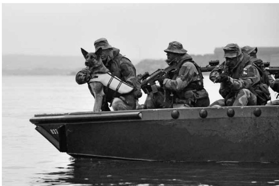
En patrull söker av en skärgårdsvik

I skrivande stund befinner sig kompaniet på ostkusten och deltar i marinens övning SWENEX 13. Samövning med marinens