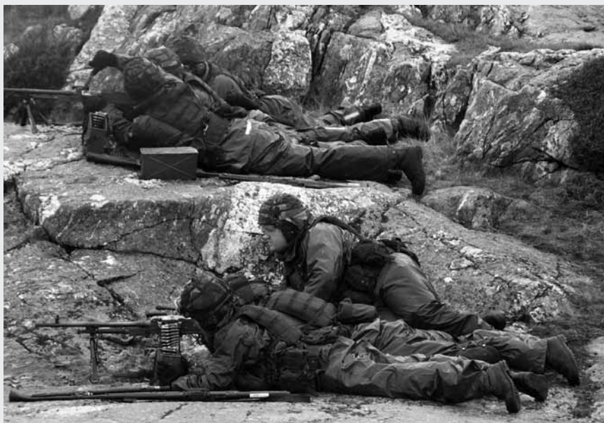
Skjutning med skarp ammunition på Känsö