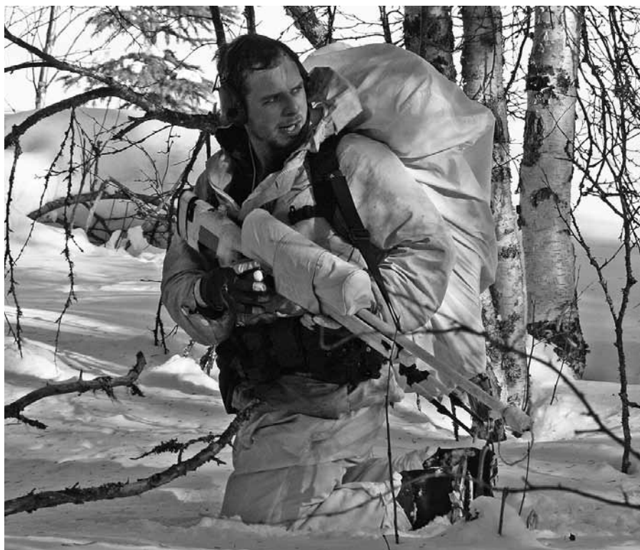
Vinterövning i Norrland

Under våren har förbandets mer erfarna patruller fortsatt sina befattningsutbildningar (spaning, sjukvårdare, prickskyttar, båtförare,