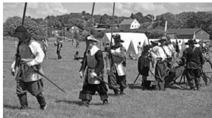
Gustav II Adolfs fotfänika tar del av stödet från FVMA. Här under kanonexercis på Garnisonens dag.

Som ett exempel på traditionsföreningar som utnyttjar stöd från FVMA, vilket man kan läsa om härintill, har vi här ett militärmuseum som inte låter sig nedslås av minskade anslag.