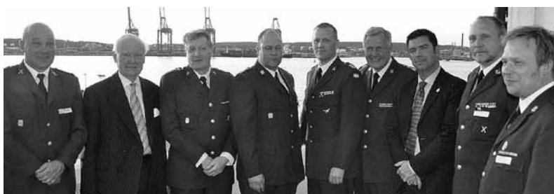
Högtidsklädda chefer på Mässens altan