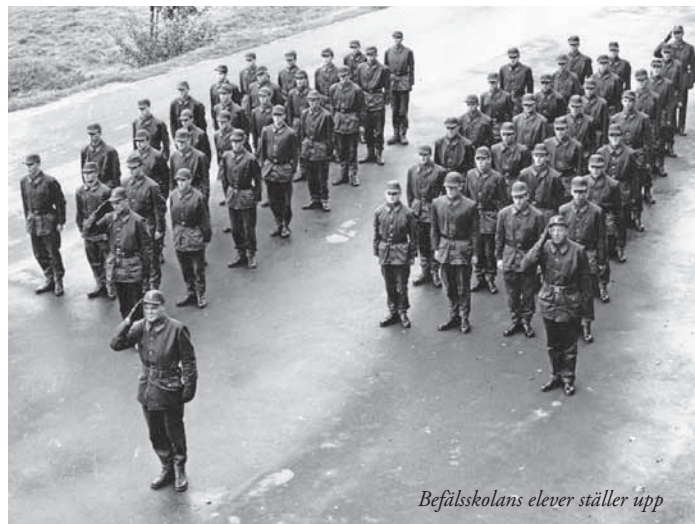
Befälsskolans elever ställer upp