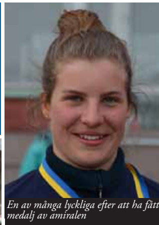
En av många lyckliga efter att ha fått medalj av amiralen