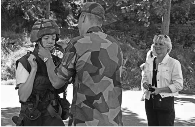
En yngling prövar stridsutrustningen under mammas uppsikt