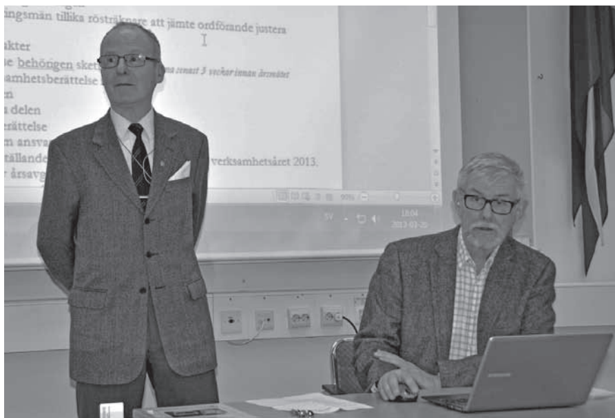
Ordförande och sekreterare klara för dagens förhandlingar.

ria har du sämre förutsättningar att möta framtiden. Det är vår fasta övertygelse att det inte bara är kamratföreningen, som kan ha nytta av ett nära samarbete med garnisonen, utan att dagens förband också skall se kamratföreningen som en resurs för sin personal och även utnyttjas för spridande av försvarsmaktsinformation.