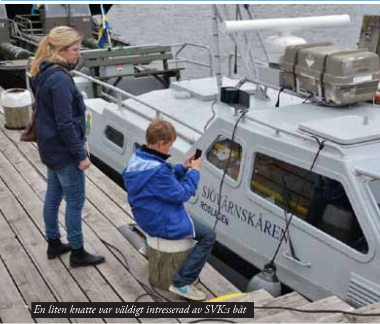
En liten knatte var väldigt intresserad av SVK:s båt