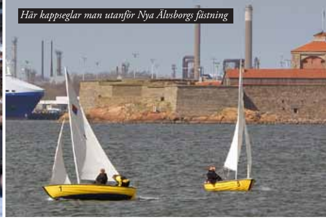
Här kappseglar man utanför Nya Älvsborgs fästning