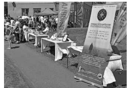
Flera Kamrat- och anhörigföreningar var på plats med information

och andra av garnisonens kompanier var på hugget. Man kan notera att de militära handvapnen verkar som magneter på de lite äldre barnen. Inte bara pojkar sågs kämpande med slutstycken och spakar på automatvapnen. Vi berördes av en tonårsmamma som med moderlig blick såg sonen pröva en stridsväst och hjälm.