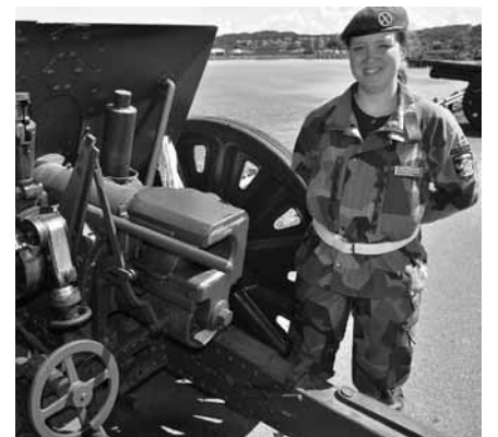
Emelie tillhör kanonbetjäningen som tjänstgjorde på Garnisonens dag