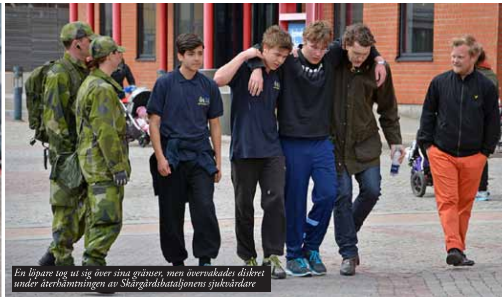
En löpare tog ut sig över sina gränser, men övervakades diskret under återhämtningen av Skärgårdsbataljonens sjukvårdare