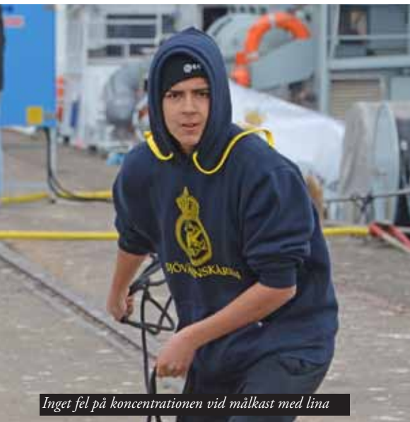
Inget fel på koncentrationen vid målkast med lina

Den 3-5 maj firade man sitt 100-årsjubileum med centrum på Eriksberg. Redaktionen hade tillfälle att träffa dessa målmedvetna och orienterade ungdomar under dagarna och vi imponerades av andan. Det man uppenbarligen lyckas med på sommarlägren på Kängö, Märsgårn och andra platser är att förmedla sådan djup kamratskap och starkt intresse för äkta sjömanskap som varje förälder och farförälder önskar sina efterkommande. Heders!