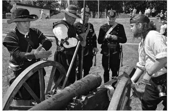
Två tjugigt uniformerade Göta artillerister inspekterar kanonen hos GA Fotfänika