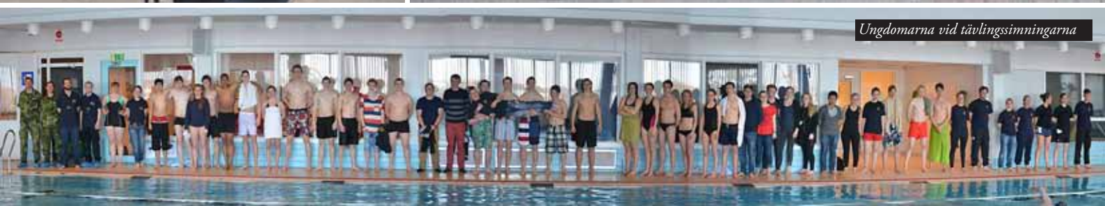
Ungdomarna vid tävlings simningarna