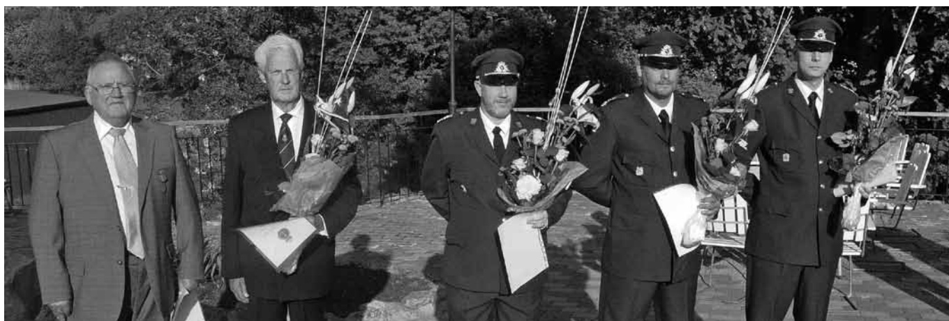
Medaljörerna i solens glans vid Älvsborgsmässen