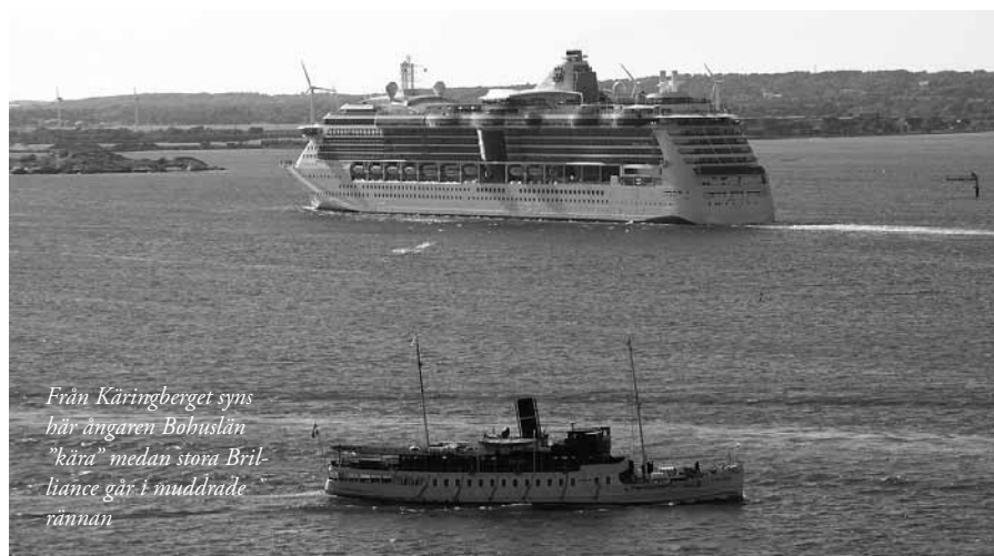
Från Käringberget syns här ångaren Bohuslän "kära" medan stora Brilliance går i muddrade rännan