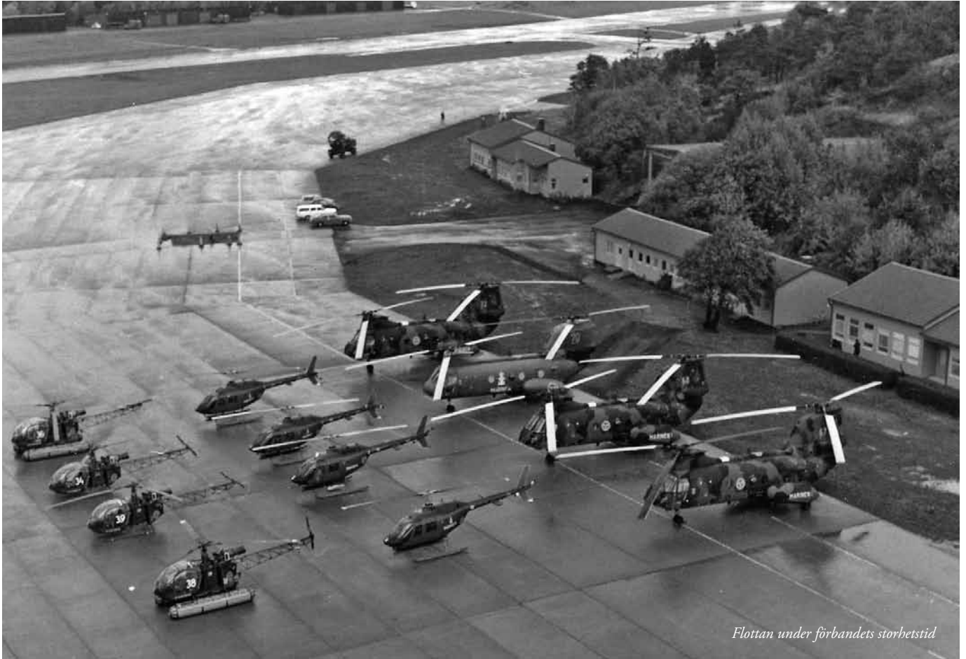
Flottan under förbandets storhetstid