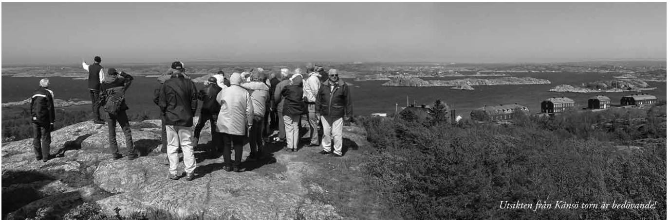
Utsikten från Känös torn är bedövande!