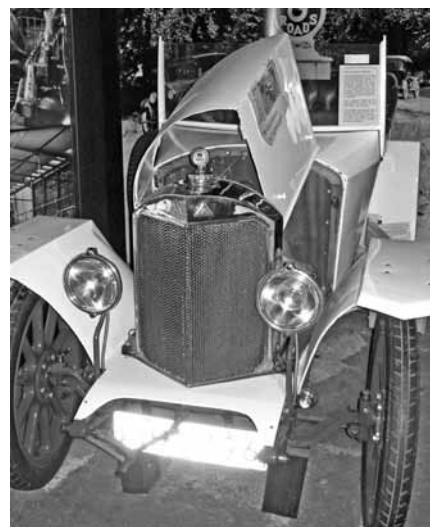
AGA:s egenproducerade gasbil

Vid en ödestiger olyckshändelse under prov med acetylenkastuber exploderade en tub och han miste synen på båda ögonen. Inget hindrade dock honom att fortsätta som företagets självskrivne ledare ända tills hans död 1937. 1912 fick han Nobelpriset. Han skänkte en stor del av prissumman till de anställda på AGA genom utdelning av en extra veckolön samt instiftande en fond på Chalmers Tekniska Högskola.