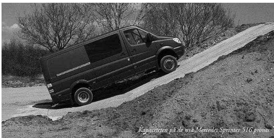
Kapaciteten på de nya Mercedes Sprinter 516 provas

Den marina bataljonens övriga insatsplutoner är inte grundtilldelad några fordon, eftersom de primärt skall förflyttas med båtar. Övriga tre bataljoners sex insatskompanier har övergångsvis tilldelats den äldre terrängbil 20, vilka ärvt från de tidigare infanteribrigaderna.