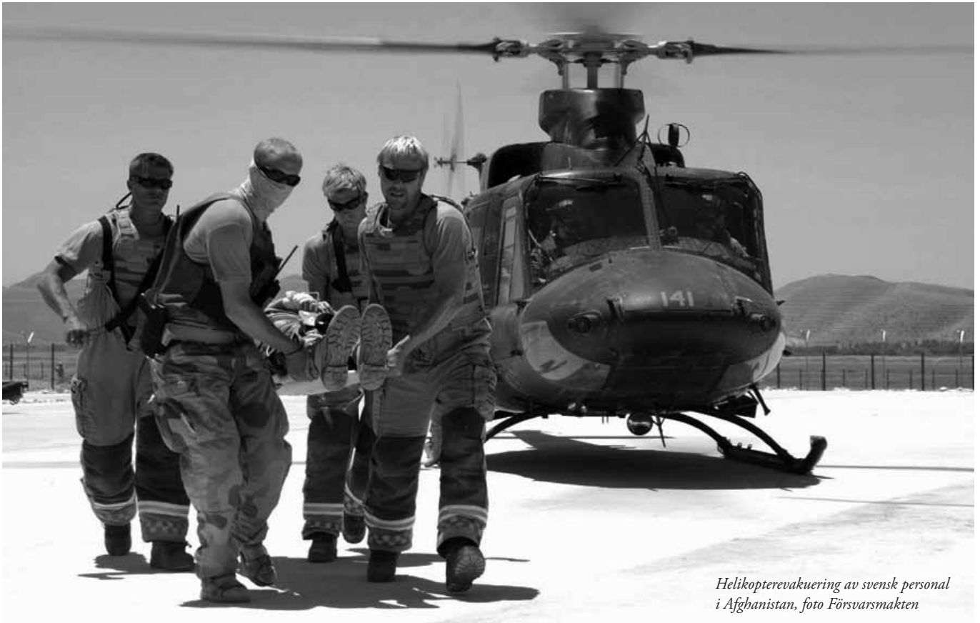
Helikopterevakivering av svensk personal i Afghanistan, foto Försvarsmakten