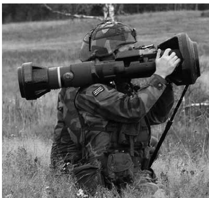
Modern ATGM – avfyrare för antitankrobot från SAAB Bofors

Utifrån dragna slutsatser kommer Försvarsberedningen i nästa skede att ges i uppdrag att redovisa en försvarspolitisk rapport innefattande konkreta förslag till vilka delar