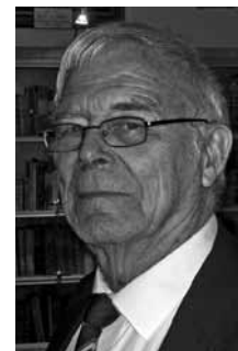
Överste Sven Wergård