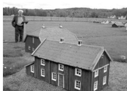
Minibyn i Timmele

Till hans uppfinningar hör bl a klipp-ljusapparaten med tryckregulator, solventilen, automatiska glödnätsbytare, biograflampor med gas till filmprojektorer, radioapparater, lustgas för medicinskt bruk, utrustning för lustgas och narkos, AGA spisen (som fortfarande tillverkas i England). Som lite kuriositeter tillverkades även en gasdriven bil. Gustaf Dalén är en av de många stora kvinnor och män, som betytt mycket för vårt lands utveckling och som gjort Sverige känt långt utanför våra gränser.