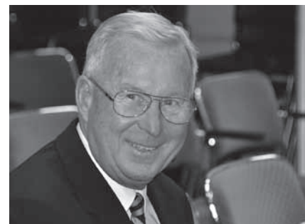
långväga medlem – "Grymme" från San Fransisco