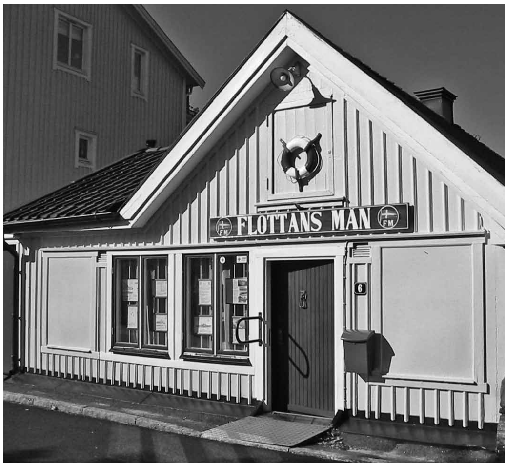
Marinstugan på Örlogsvägen vid Nya varvet