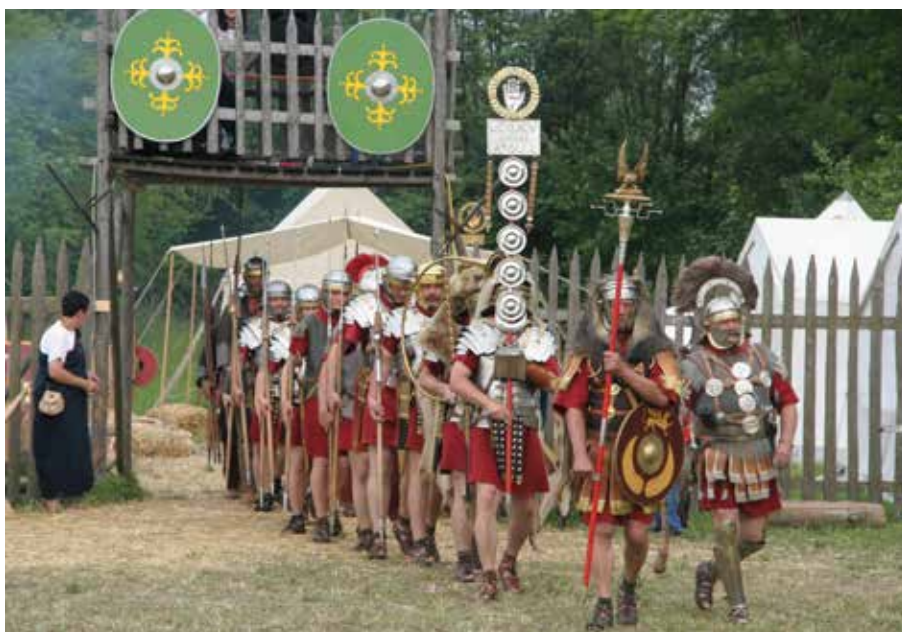
Traditionssoldater uppvisande XV legionen. Främst bärs den romerska örnen, Aquilifer och legionens Signum –fälttecknet.