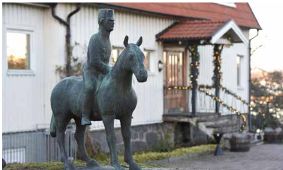
Ryttarstatyn utanför Mässen