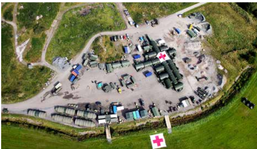
1. Sjukhuskompaniet vid AÖ-15.