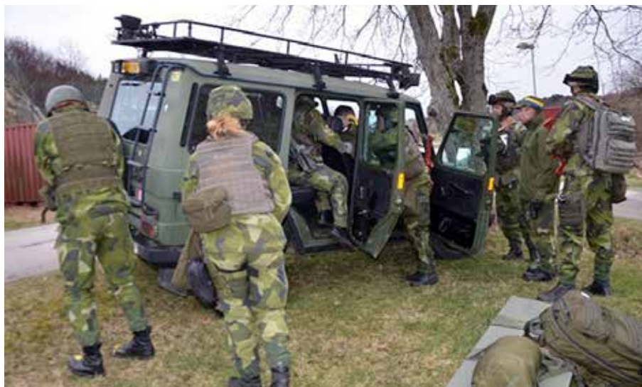
Övning i omhändertagande vid trafikolycka

Vid FömedC finns Försvarsmedicinska enheten som är Försvarsmaktens funktionscentrum inom Försvarsmedicin. Verksamheten bedrivs på två platser i landet, Göteborg och Linköping