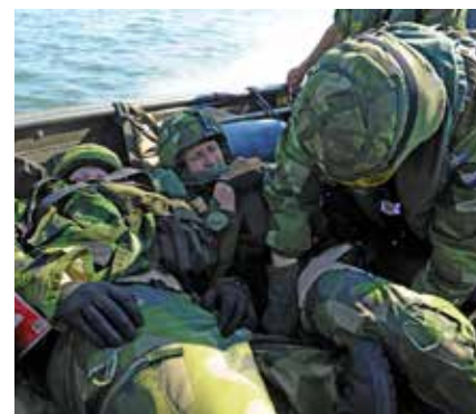
Omhändertagande måste ske omgående även under svåra förhållanden

Sammanlagt ett tjugotal elever genomförde kursen med godkänt