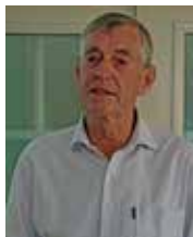
Generalmajor Svante Berg

NATO förhandslagrar nu materiel i Baltikum och genomför samövningar med deras försvarsstyrkor. Bli insatser nödvändiga så går förstärkningar och flyginsatser över Sverige. Man vill då använda svenska flygbaser mm. Kan man förhandslagra materiel vinner man tid och kraft.