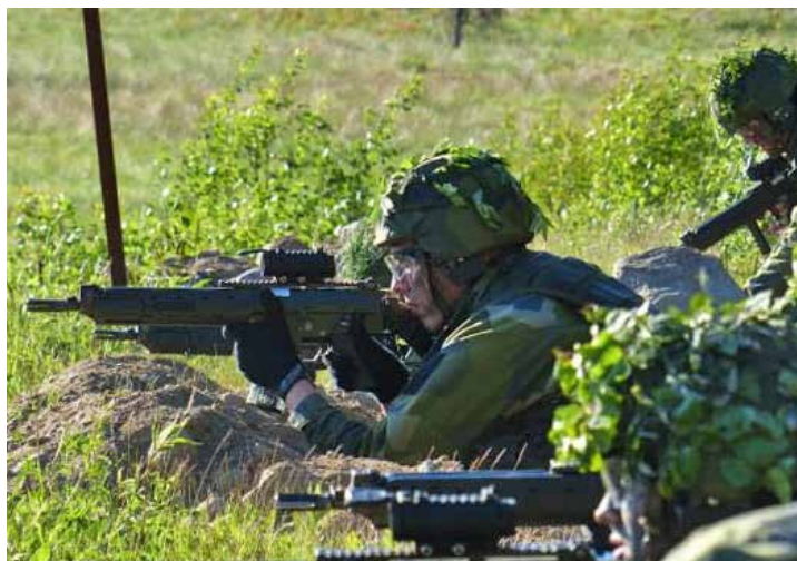
Den grundläggande utbildningen omfattar många kompetenser

Kolla gärna den trevliga bloggen på: blogg.forsvarsmakten.se/gmu89ebg