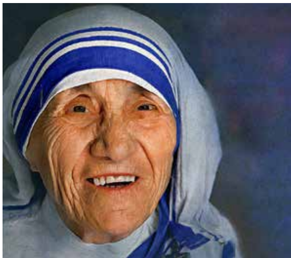
Moder Teresa, 1910-1997, kristen nunna som var verksam i Indien. Nobels fredspris 1979.