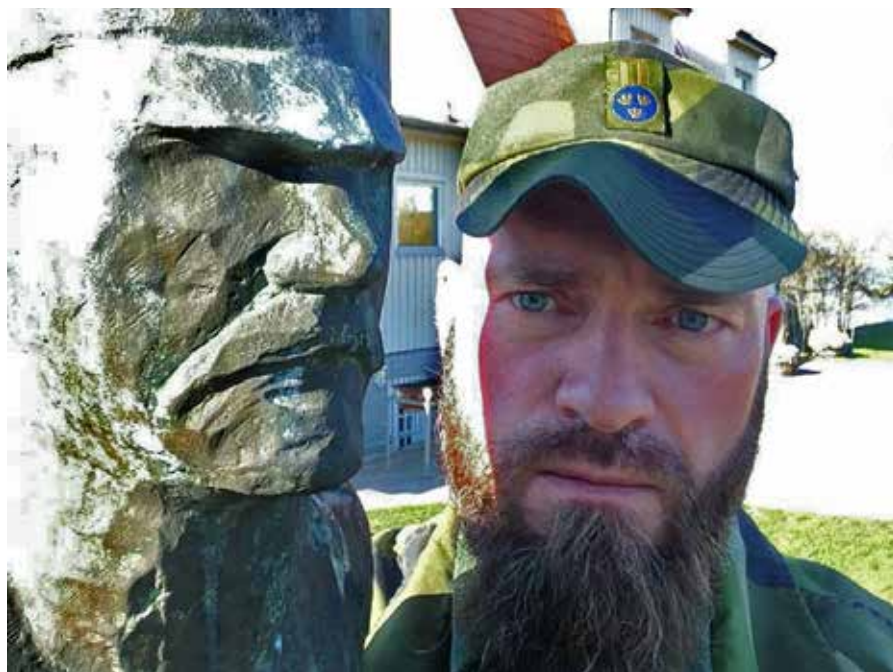
Två soldater. En i brons och en av kött. Men båda har samma pappa