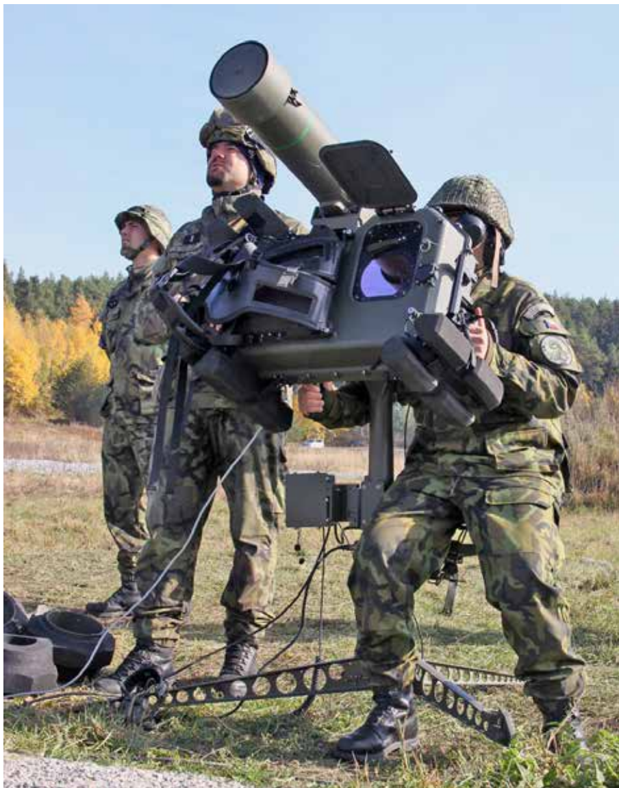
Robot 70 är ett bärbart luftvärnsrobotsystem

Detta torde vara det enda realistiska sättet att snabbt återskapa en nationell bottenplatta. Beroende på rekryteringsförmåga kan delar av förbandet vara bemannat via plikt. Operativ osäkerhet skapas primärt genom att alla bataljoner kan vara beväpnade med moderna kvalificerade "lätta" vapen med hög verkan, t.ex. granatkastare med smart ammunition, pansarvärnsrobotar, bärbart.