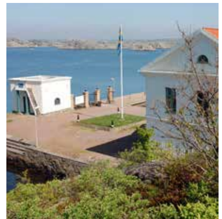
Sommarfager uppställningsplats på Käsö med ibland "störande" trumpet. Den unika parloiren t v och det olivfärgade chefshuset.