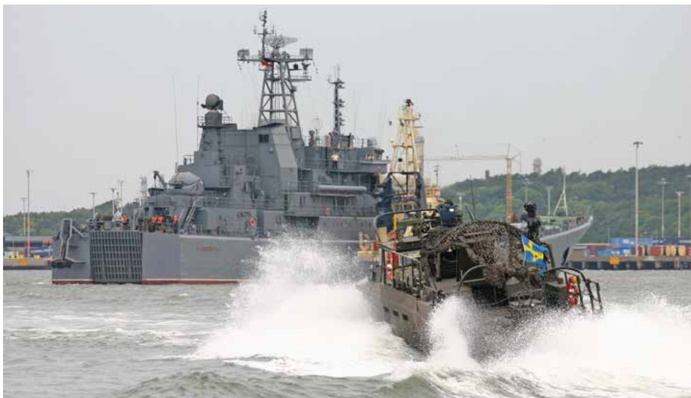
Ryska landstigningsfartyget Kaliningrad i Göteborgs hamn.