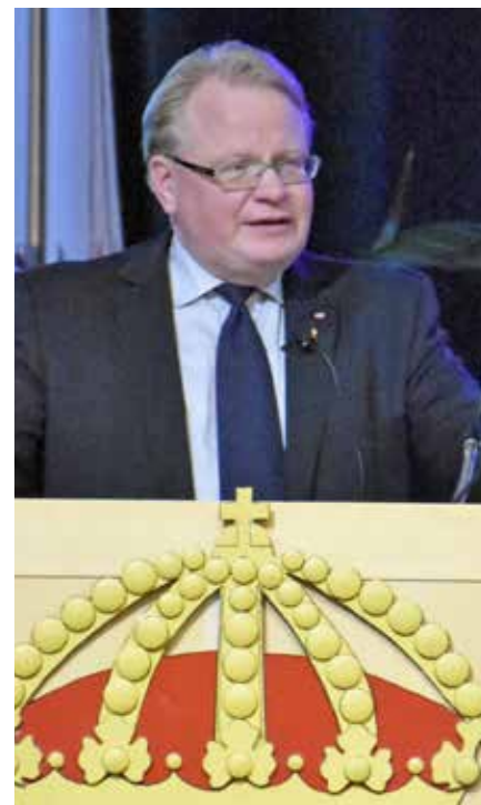
Försvarsministern lovordade Hemvärnet

värnssoldatens familjer i händelser av ofred togs också upp och Försvarsministern drog paralleller till andra världskriget och menade att om det otänkbara händer, så kommer hela familjen att bli inblandad. Detta kräver dock en oerhört stor omställning av hela samhället eftersom det gamla civilförsvaret demonterats och även här finns en stor förbättringspotential.