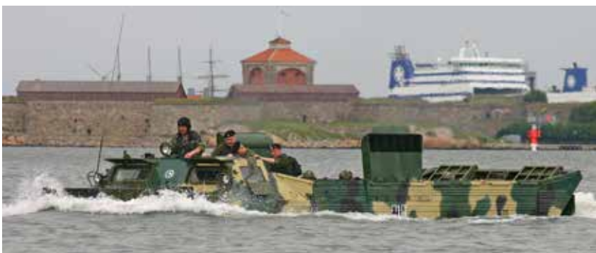
Ryska landstigningsfarkoster vid Nya Älvsborg. Hua!