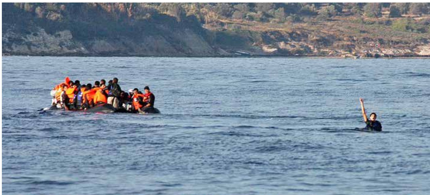
KBV447 når fram till nödställda vid Lesbos