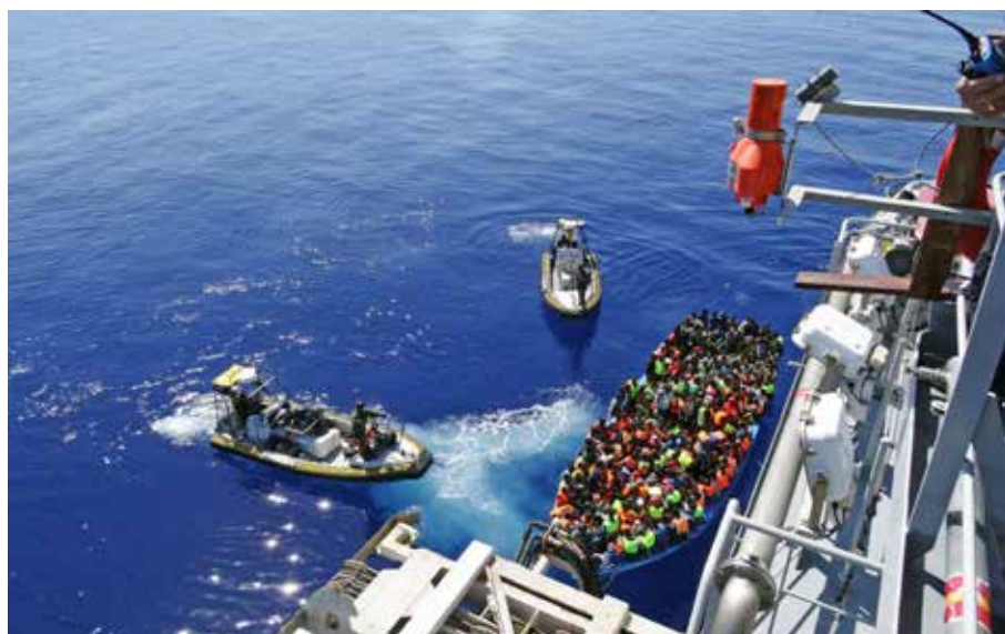
KBV001 räddar 353 personer 55 Nm nordväst om Tripoli

Sedan den 1 oktober deltar KBV 477 i Frontex operation Poseidon och då stationerad vid ön Lesbos. KBV 477 bemannas av tre kustbevakare och en sambandsman från grekiska kustbevakningen och KBV har två besättningar på plats i Grekland. Utöver personalen på Lesbos har vi även en sambandsman i Pireus på ICC. Sedan