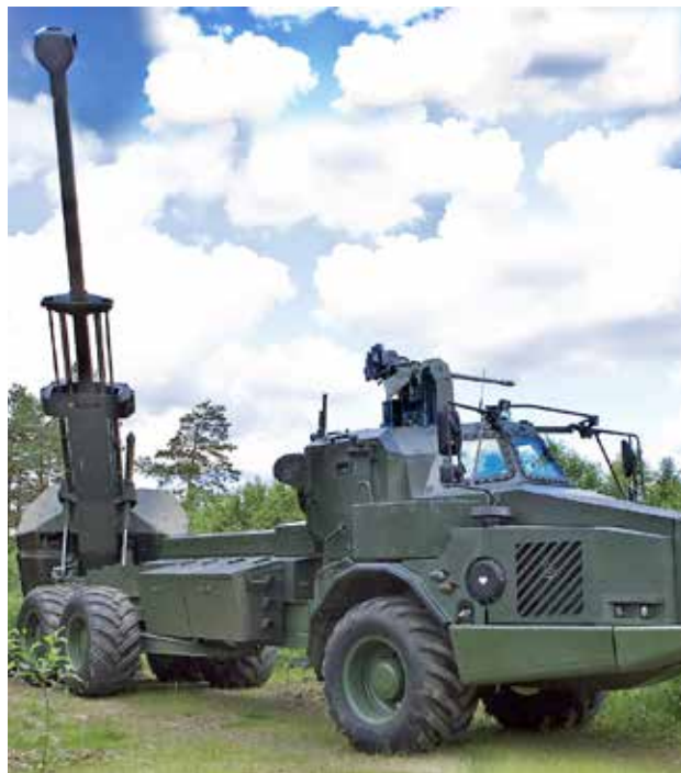
Archer är ett självgående eldrörsartillerisystem som kan skjuta 155 mm precisionsgranater med hög eldhastighet

Beträffande internationella insatser så fortsätter vår utbildningsinsats i Irak, där vi tränar de kurdiska Peshmerga-förbanden. I Mali har vi stabsofficerare och spaningsförband och i Afghanistan olika rådgivare. Nästa år inleds nästa försvarsbeslutsperiod där FM tillförs mer än tio miljarder kronor. Vi skall nu inte slösa kraft på vad vi inte fick, utan ägna oss åt hur vi skall öka vår operativa förmåga med det vi får. FM har t.ex. redan nu lagt beställning på två nya ubåtar, beställt nästa generation av JAS GRIPEN, modifiering av korvetter och andra fartyg samt anskaffning av nya under-