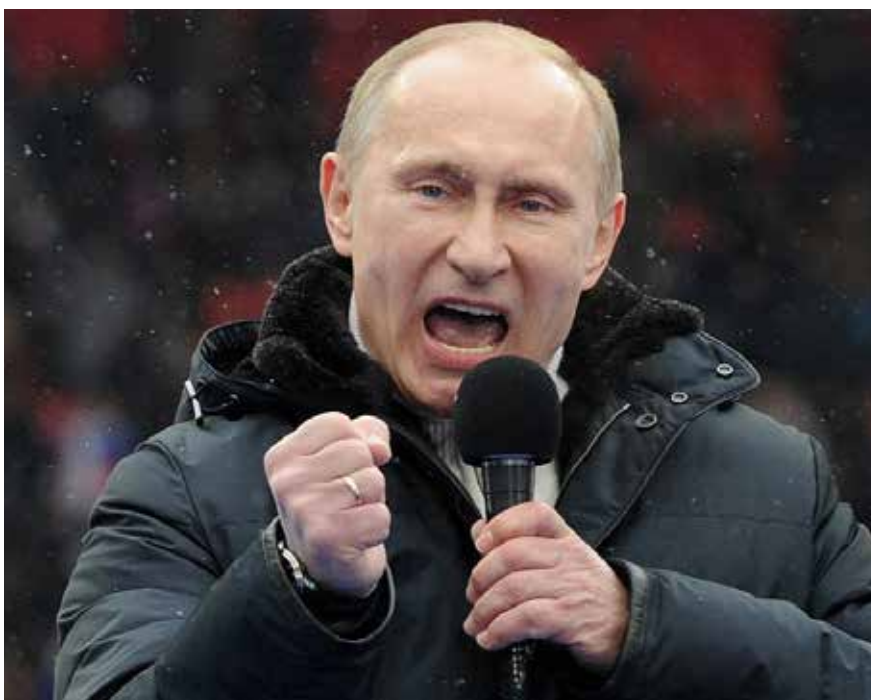
Vad vill Putin med Sverige?