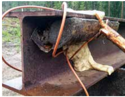
Sprängdeg är mycket säkert och lätt att applicera