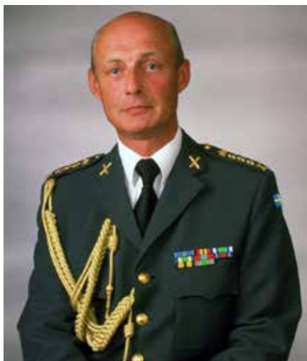
Överste Lennart Klevenparr

FM har även deltagit i ett stort antal internationella övningar i närområdet och senast i den stora NATO övningen i Spanien, Portugal mm. Högkvarteret genomför årligen olika former av ledningsövningar och då främst med Insatsstaben. I år har vi även under 14 dagar tränat dem militärstrategiska