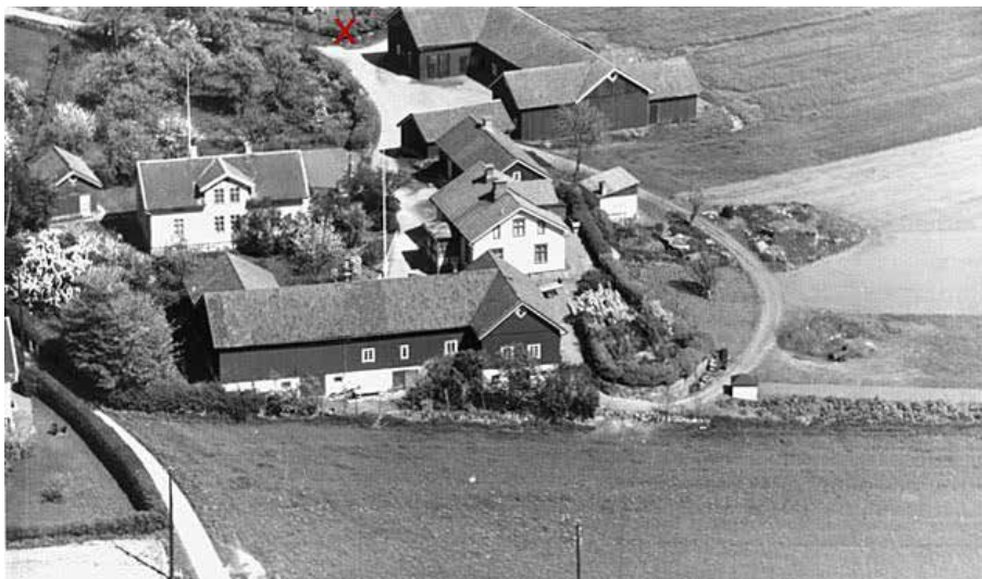
Flygbild över Lonsegården från 1940-talet med stenens nuvarande placering markerad

Du kan också anmäla dig på www.ghvfgbg@gmail.com