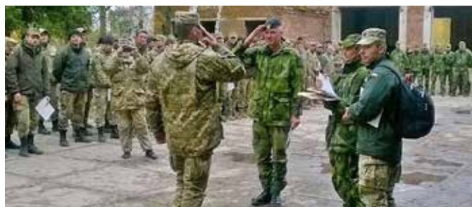
Ceremoni i Ukraina vid vår stridssjukvårdarutbildning.

Tiden rusar fram och ytterligare ett verksamhetsår går mot sitt slut. Jag tänkte ta tillfället i akt att se tillbaka på året som gått, både ur ett centralt och lokalt perspektiv och även förmedla några tankar om framtiden.