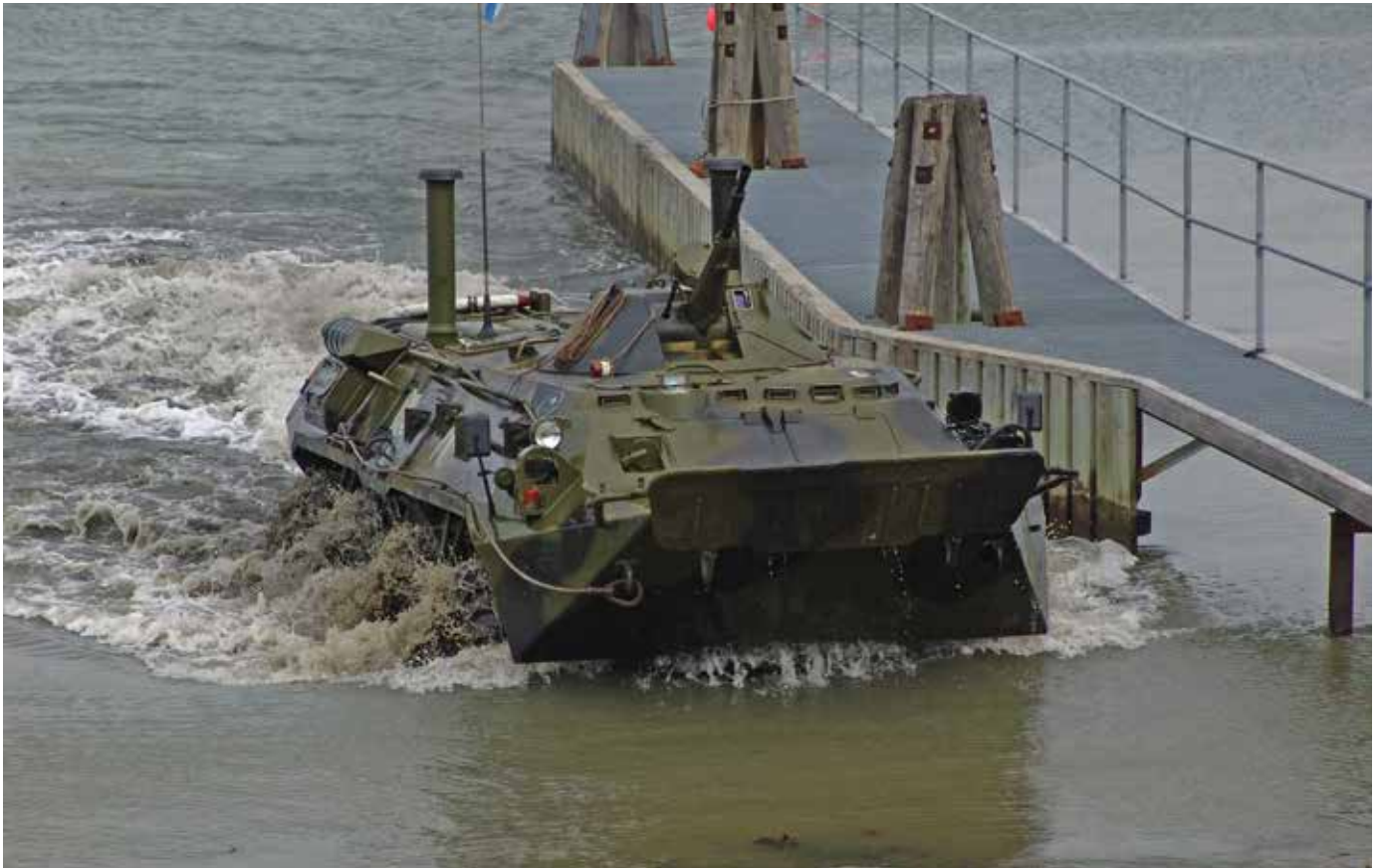
BTR 80 med höjda snorklar visar sin amfibieförmåga i Forthammen.

ökad förståelse för varandras sätt att tänka. Syftet med besöket var bland annat att vi skulle lära känna det ryska sättet att strida, utbilda och tänka. I förlängningen skulle samarbetet bli ett stöd för demokratiseringen av rysk militär och på så sätt vara till gagn för ökad fred och säkerhet i vår del av världen. Besöket i Göteborg avslutades med en gemensam uppställning på Kåringberget med tal av respektive förbandschefer och utdelning av olika hedersbetygelser till både chefer och soldater.