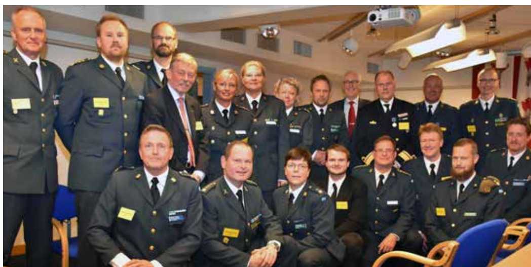
Elfsborgare på årets Rikshemvärnsting, här med inbjudna gäster

från Föreningen För Göteborgs Försvär (FFGF) gästade tinget och FFGF har från i år instiftat ett stipendium på 25 000 kronor, där särskilt väl skrivna motioner premierades. Sammanlagt fem premier delades ut, dock ingen till någon av motionerna som inlämnats från Försvarsmedicinskt centrum's bataljoner.