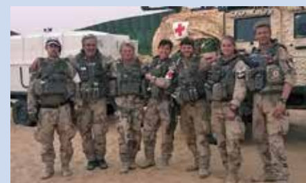
Kvalificerad grupp ur 1. Sjukhuskompaniet på mission i Mali

fält på olika uppdrag. Utrustningen, både den egna och sjukvårdsmaterielen skulle förberedas, ses över och även skall vi öva en del själva. När man sedan kom tillbaka till Camp Nobel från ett uppdrag var det vila och återhämtning, för att sedan förbereda nya uppgifter. Det finns ett väldigt bra gym på Campen.