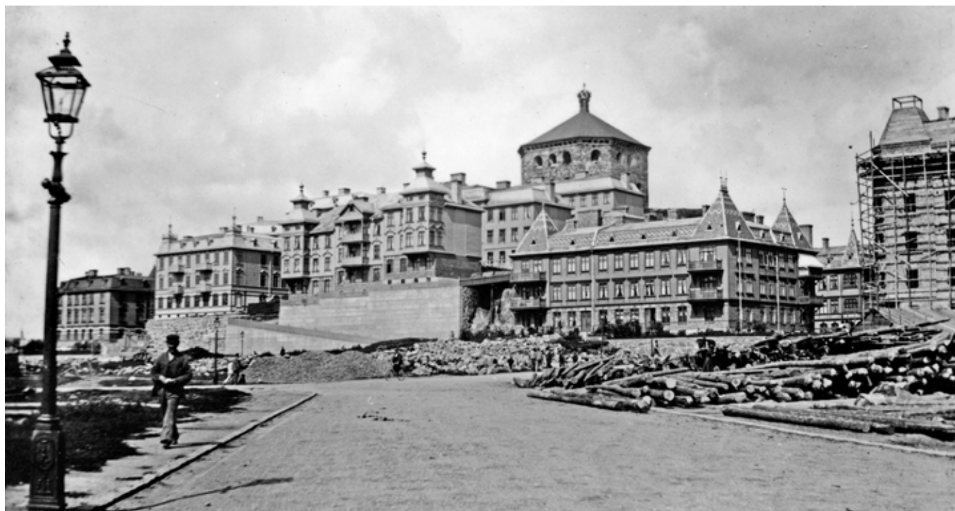
Unik bild från ca 1910 före byggnationen av Kastellgatan och Majorsgatan. På berget syns de vackra landshövdingehusen som revs på 1960-talet. Till höger sådana träpålar som hela Kommendantsängens byggnader vilar på.