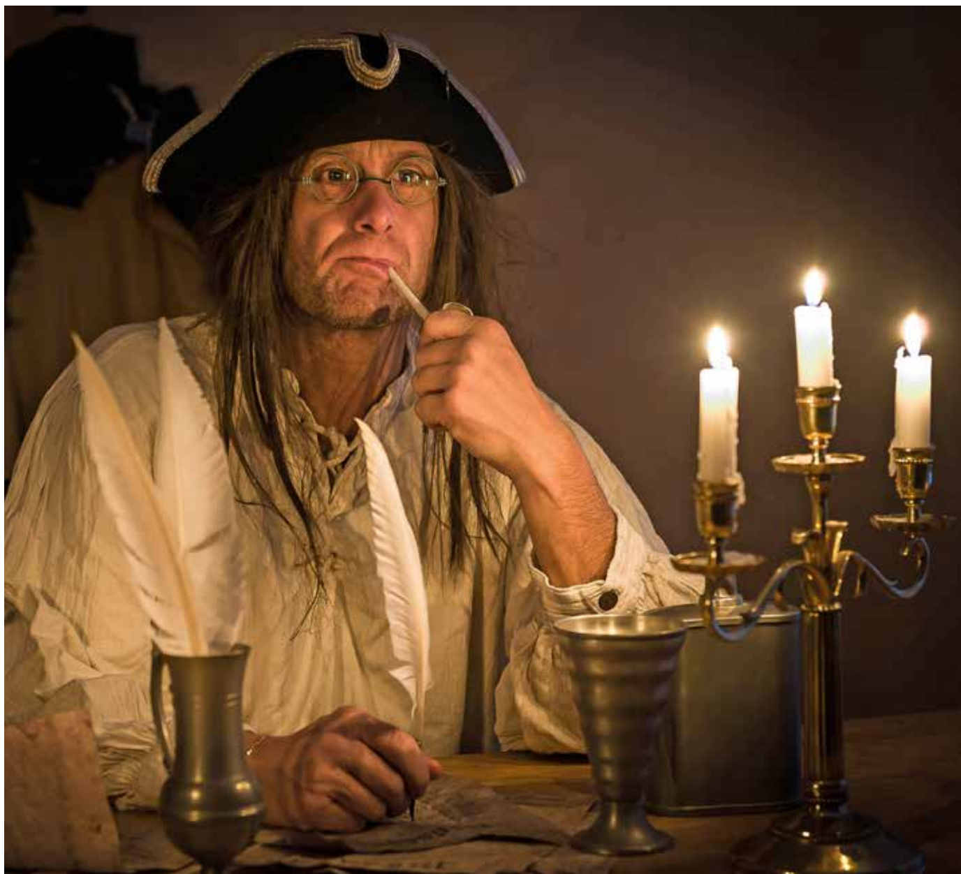
Författaren i tänkarhatt från 1710-talet.