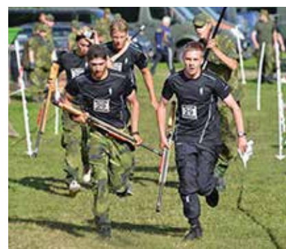
Elfsborgsgruppens ungdomar på uppløpet

Nu är ju inte livet så lätt när det är orientering inblandat... När patrullorientering, snabbskytte och snabbmarsch efter ca 90 minuter stod laget från Elfsborgsgruppen som segrare med nio minuters marginal. STARKT! Det som avgjorde var jämnheten över två dagar ihop med stabilt skytte och säkra orienterare sista dagen. Laget kommer från Ungdomsverksamheten i