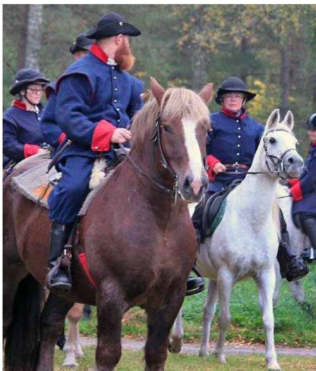
Västgöta ryttare deltog i minnesmarschen med 1600-talsuniformer