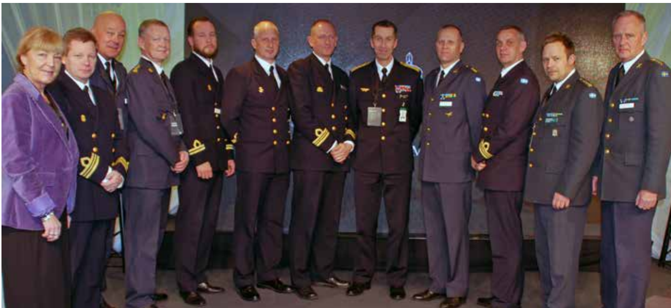
Göteborgscheferna samlade hos ÖB.

över de insatser som görs inom ramen för hemvärnsverksamheten. Tydliga exempel på detta är 43. hemvärnsbataljonens understöd med transporter i skärgården till kampanjen "Håll Västkusten Rent" tidigare i höstas och Hemvärnets musikkår Göteborg som fick det ärofulla uppdraget att stå för musiken vid högvaktsavlösningen i samband med det officiella firandet av Hemvärnets 75-årsjubileum i september.