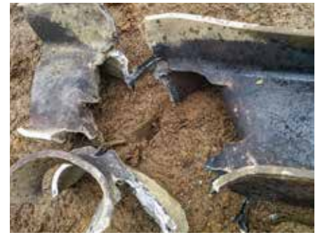
Den grova stålbalken efter detonationen