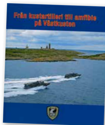
Boken kan beställas från Kamratföreningen

Ombord är skeppsklockan ett närmast heligt ting. Det är nog bara ankaret som har liknande symbolik. Ankaret står för trygghet, hopp och tro, medan skeppsklockan står för varsel och mystik. Det finns många historier om skeppsklockor som slagit av sig själv för att varna för fara, även om klappen varit surrad för att den inte skulle slå vid sjögång.