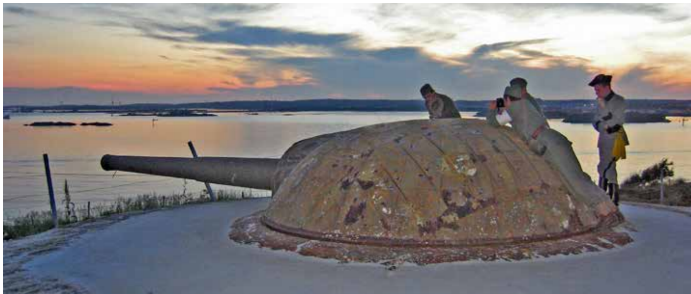
Traditionsklädda soldater 2005 vid en 6-tums tornpjäs på Oscar II fort