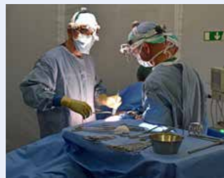
Ett av Fältsjukhusets operationslag

Under vecka 20 genomförde SWEDEC (Swedish EOD and Demining Centre, Sveriges kompetenscentrum för nationella och internationella uppgifter inom ammunitions- och minröjning) inom ramen för övning SEE 17 samövning med andra myndigheter inom totalförsvaret.