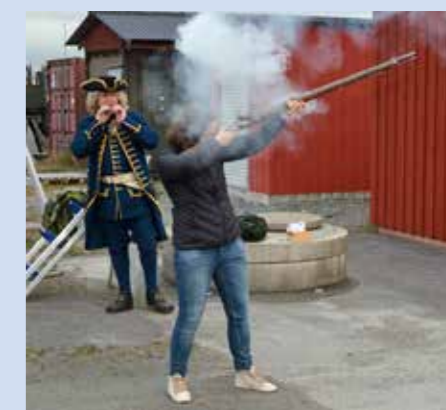
Rökfritt krut var inte uppfunnet på 1700-talet