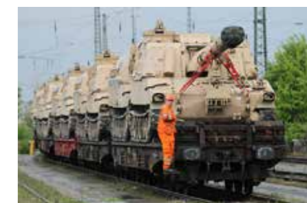
Tåg med M109 Paladin 155 mm haubitser anländer till Rumänien

Det som här beskrivits avser primärt US Army. En motsvarande planering görs för US Air Force, US Navy och US Marine Corps. Den senare verkar primärt vara inriktad mot Skandinavien och Kalla krigets bergslager i Trondheimområdet har ånyo börjat fyllas med förhandslagrad utrustning. Mest problematiskt är sannolikt hur behovet av flygbaser med fokus på norra Östersjön och Baltikum skall säkerställas. Sannolikt har statsminister Löfvén redan fått klart för sig västvärldens förväntningar på oss i denna fråga och vi