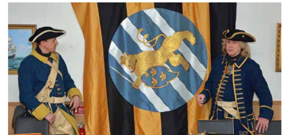
Karolinerna bereättade om soldatlivet och uniformer på 1700-talet

Vad gäller de båda karolinerna som vi träffade i baren tidigare på kvällen, så visade det sig att de inte alls kom