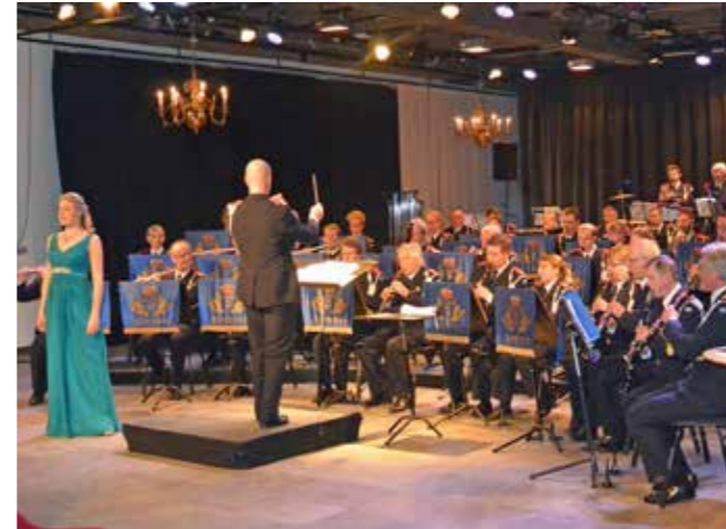
Musikkåren i Kronhuset

Hemvärdnets musikkår i Göteborg fyllde 75 år 2016. Det firades under trevliga former med en konsert i Kronhuset i Göteborg lördagen den 4:e februari.