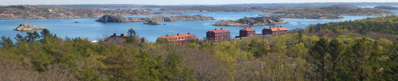
Från Känsö torn är utsikten bedärnande – här med Göteborg och Hisingen i fjärran

Mellan de två stora magasinerna finns två byggnader för sjukvård. Till den större – pestsjukhuset – fördes den sjuke med båt till ett valv under golvet där den sjuke hissades upp, lades i ett badkar och med hjälp av krokarna och liknande kläddes av. Sjukvårdarna som bar vaxdukskläder gned sedan i personen med ättika. Sjukhuset isolerades från omvärlden med personal och allt.