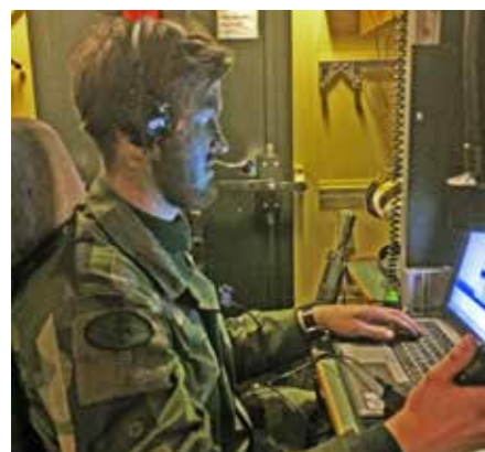
Containern är praktiskt inredd

Värnen som bemannas skall givetvis inte synas från farligt håll (utåt från ledningsplatsen), kunna fungera som skydd, men även möjliggöra att soldaterna tar sig mellan värn och ledningsplats relativt osynligt. Det är mycket att tänka på, för att inte tala om den stora mängd jord som måste tas upp ur marken.