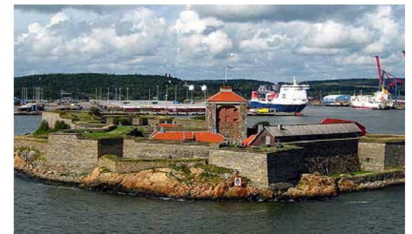
Nya Älvsborg togs i bruk på 1600-talet och har präglat infarten till Göteborg sedan dess.