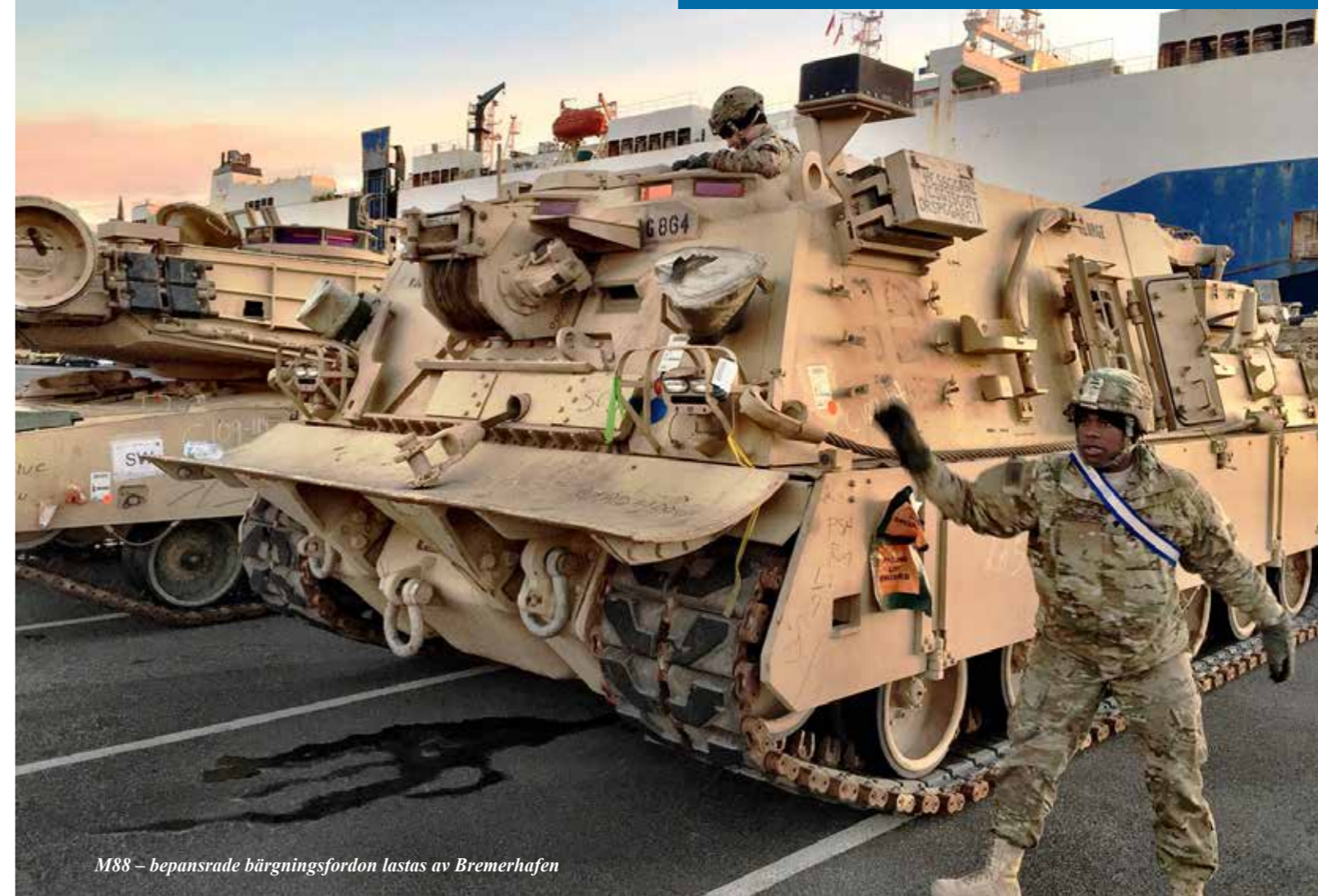
M88 – bepansrade bärgningsfordon lastas av Bremerhafnen

den till Polen baserade stridsgruppen men amerikanska förband förväntas uppträda så frekvent i de baltiska staterna att det närmast kan liknas vid en permanent basering.