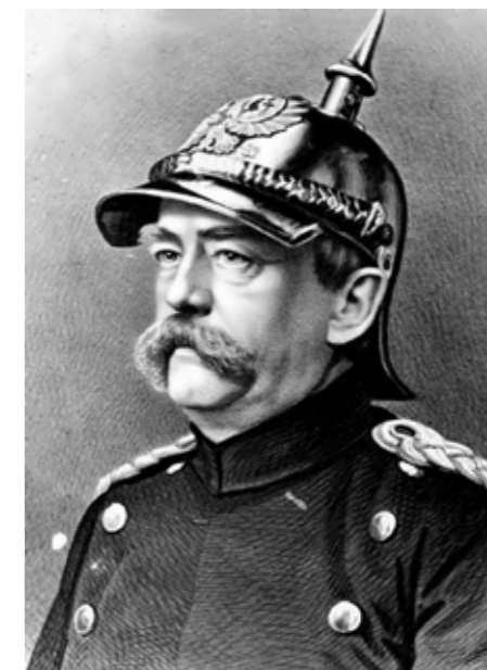
Pickelhjälmen blev populär i många länder efter Bismarcks seger över Frankrike 1871