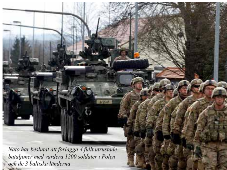
Nato har beslutat att förlägga 4 fullt utrustade bataljoner med vardera 1200 soldater i Polen och de 3 baltiska länderna

Under våren har förband från 17 Nato-stater börjat samlas i 4 stridsgrupper, vardera med ca 1200 soldater och utrustade med stridsvagnar, pansarskytte och artilleri. En i vardera Estland, Lettland, Litauen och Polen. Tillsammans med världänderna innebär detta att man tydligt markerar att ett angrepp på ett medlemsland är ett angrepp på hela alliansen. Formellt ingår amerikanska enheter endast i