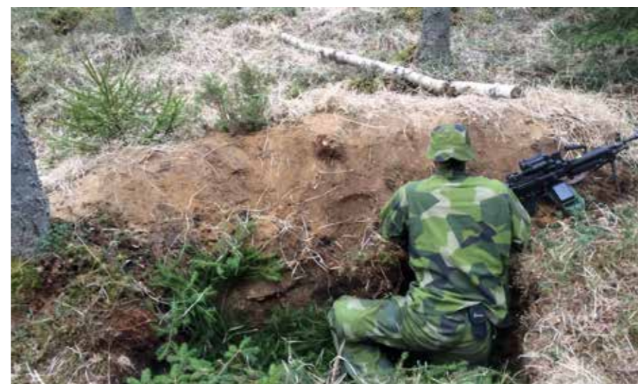
Ett bra värn är som alltid soldatens bästa vän

Vilka är de stora utmaningarna som chef vid den här typen av förband? – De är att det är så otroligt mycket att