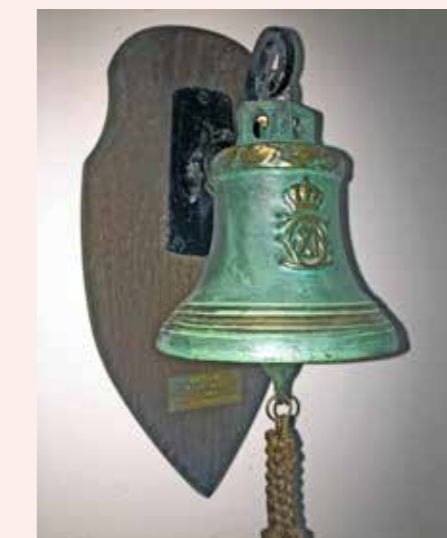
Kajs egen klocka - en present från Orion på 50-årsdagen