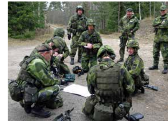
Chefsutbildning i HvSS

årsskiftet, ser tillbaka på mina 42 år i uniform så tillhör mötet med Hemvärns- och frivilligpersonal en av de allra mest stimulerande erfarenheterna jag upplevt. Era insatser är viktiga, efterfrågade och uppskattade.