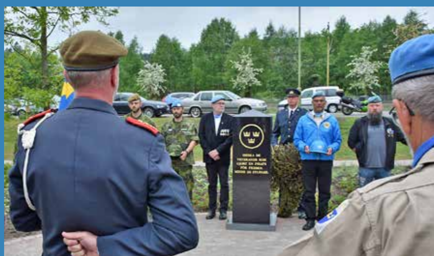
På veterandagen den 29 maj invigde Fredsbaskarna Sjuhärad en minnessten i Borås. HvMk Borås deltog med samlingsmusik och fanfar.