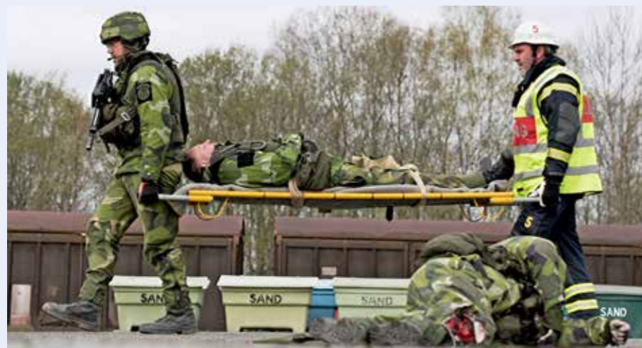
I Totalförsvaret hjälps man åt

Daggen glimmar i gräset och genom den annars så stillsamma småstadsidyllen hörs plötsligt en kraftig explosion. Snart fylls gatorna av febril aktivitet, militära fordon, ambulanser, polisbilar och brandbilar strömmar in i Eksjö.