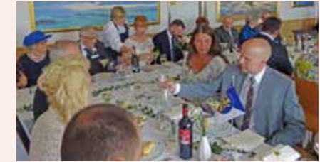
Mässen rymmer stora eller små sällskap

Hemvärdnet samarbete med Älvsborgsmässen och Garnisonssällskapet har nu förbättrats. Våra hemvärnsförband representeras numera av Garnisonssällskapets hemvärnsektion. Vår mäss erbjuder stora möjligheter till möten och samvaro under trivsamma former. Eller varför inte ett bröllop? Här rapporterar Pierre Alpstranden från just ett sådant som ägde rum nyligen.