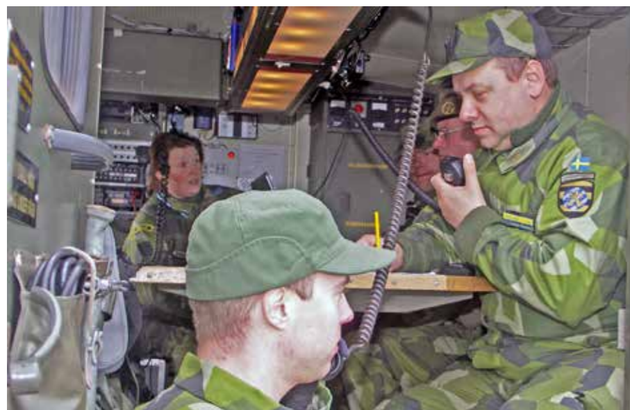
I ledningsfordonet jobbar signalister och stabsassistenter

Bataljoner och kompanier är alltså sammansatta av soldater och specialister. Soldater rekryteras inom Elfsborgsgruppens fyra Hemvärnsbataljoner från det "värnplikssystem" som vi tidigare hade i Sverige – ett system som vi nu kommer att återgå till – även om det inte blir på riktigt samma villkor!!