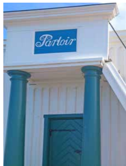
Parloiren är världens enda bevarade av sitt slag

bland annat innebär att ledamöterna regelbundet behandlar remisser från Försvarsdepartementet, men akademien bedriver även egna studier kring relevanta frågor.