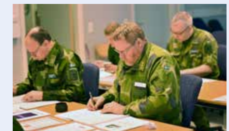
Kursdeltagare i djup koncentration

Kursen omfattade bland annat roller som fartygschef/båtchef och farligt gods-ansvarig ombord, hur farligt gods klassificeras och märks, krav som finns på stuvning och separation ombord, vilka krav som finns på förpackningar och dokumentation i samband med