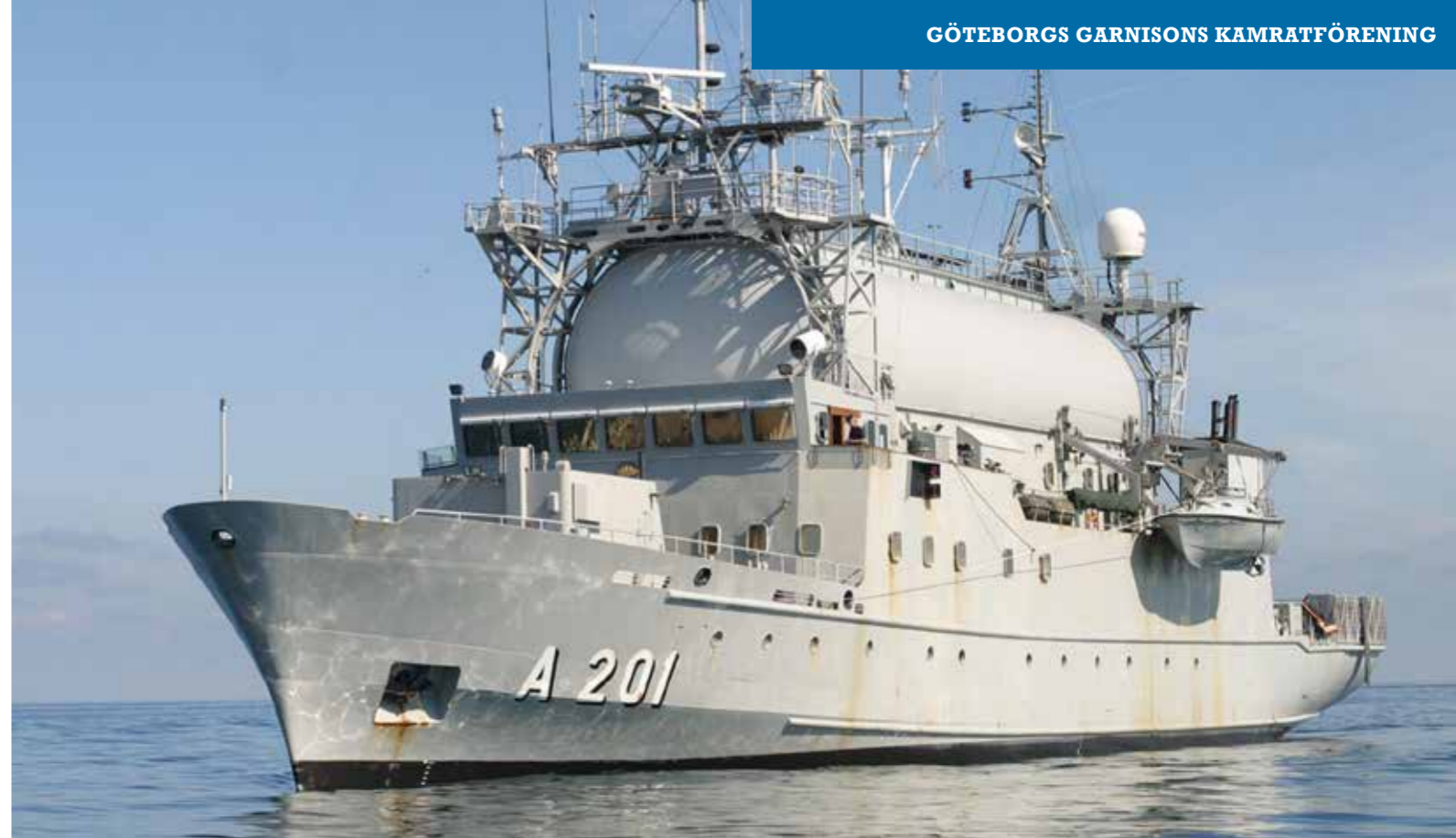
Den märkliga domen upptill är ett vinyltält som skyddar FRA:s utrustning mot väder, men även mot insyn av obehöriga.

Första företaget jag var med på startade i Karlskrona. Jag gick på min vakt när vi fortfarande var inomskärs. Det var med något skakiga knän jag navigerade ut förbi Kungsholmens fort. Drog