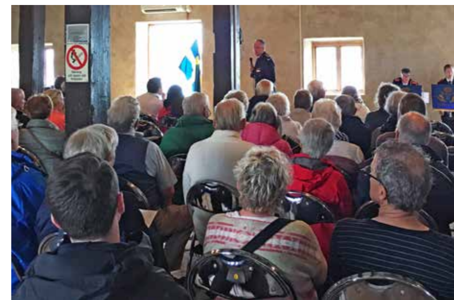
Årets korum på Känsö hölls inne i Östra magasinet.