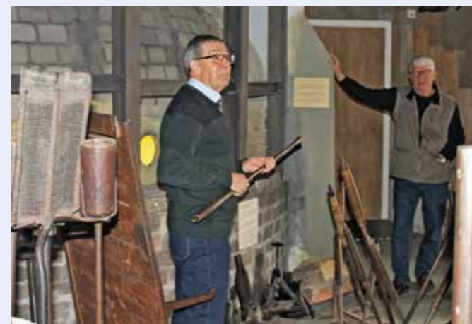
Guiderna var mycket kunniga och berättade allt om glashantverket