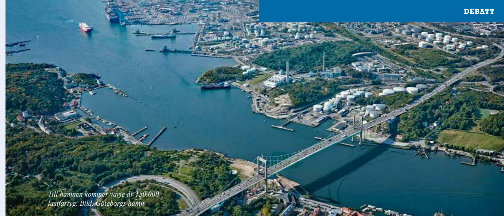
Till hamnen kommer varje år 150.000 lastfartyg.