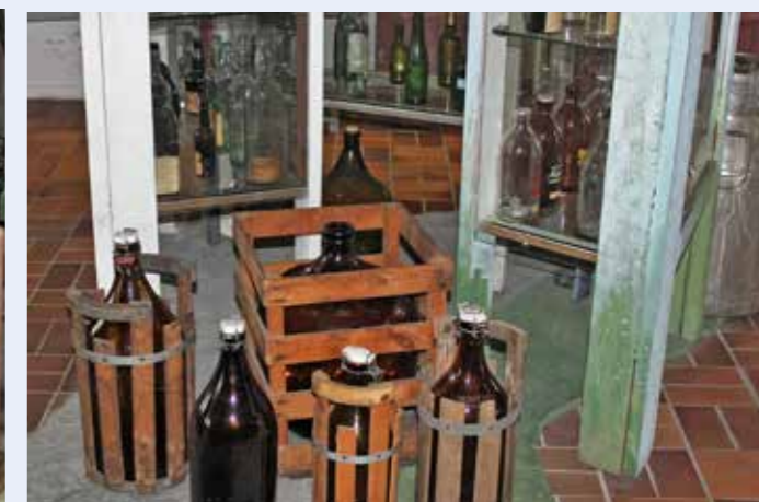
Bland alla flaskorna mindes vi nostalgiskt dessa svagdricks-damejeanner