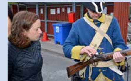
Lite krut på fångpannan...

På bilderna ser vi hur intresserade från 1. sjukhuskompaniet provskjuter en äkta flintlåmsköt från tidigt 1700-tal.