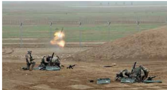
Övning under ISAF-missionen i Afghanistan 2011

I skrivande stund har jag för någon helg sedan genomfört intro med stöd