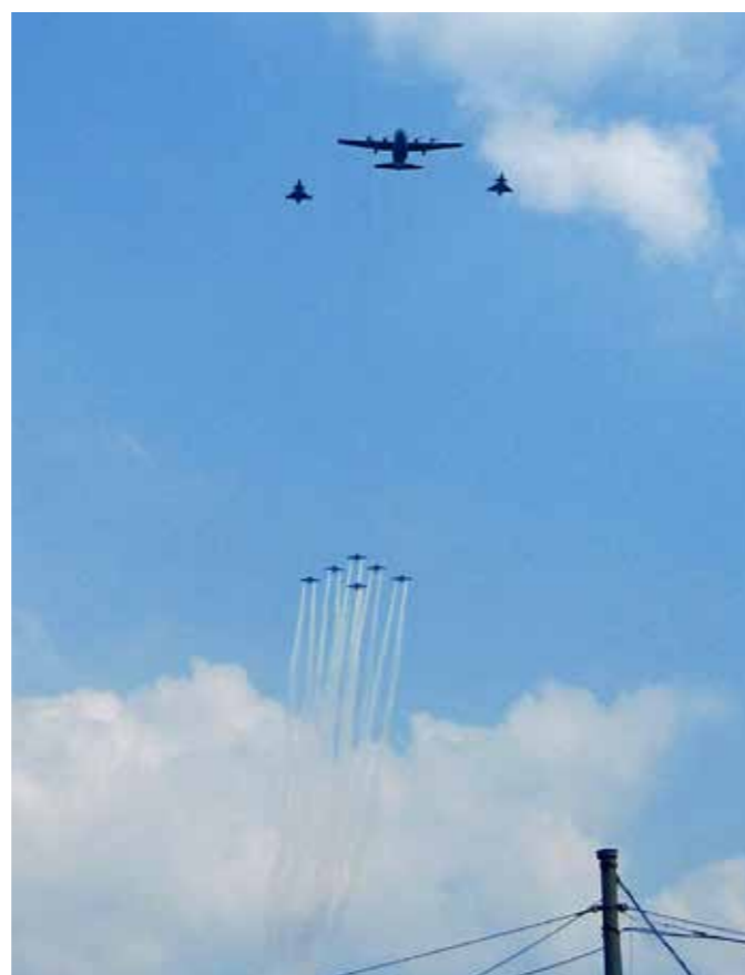
Snacka om hejarklack. Men så vann Hkpflj också!

TEXT OCH BILD ELISABETH STÅHL FRISKVÅRDSLEDARE VID FÖMEDC