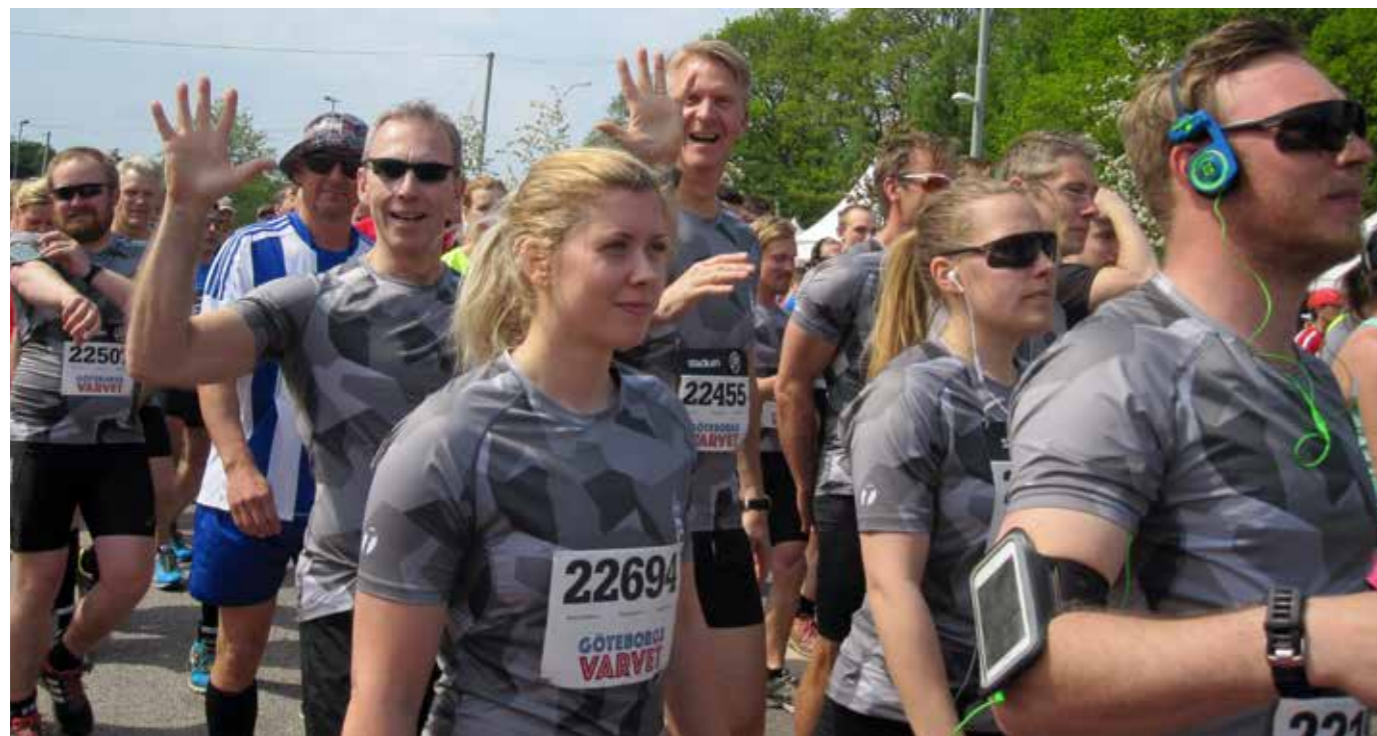
Ett glatt gäng vid starten