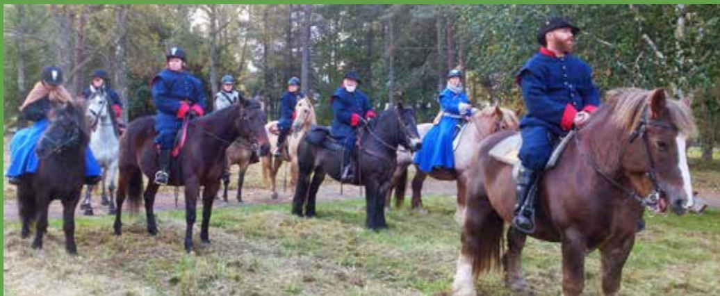
Kanske kommer Karolinerryttarna att visa vägen i år också?

Start: 09.00 Lokalbuss nr 150 från Resecentrum