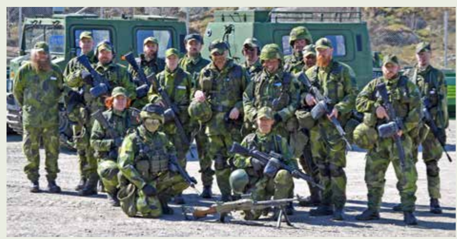
En grupp från Skärgårdsbataljonen visade upp sin förmåga

MARIA LÖFSTRÖM BEMANNINGSAVDELNINGEN, FÖMEDC