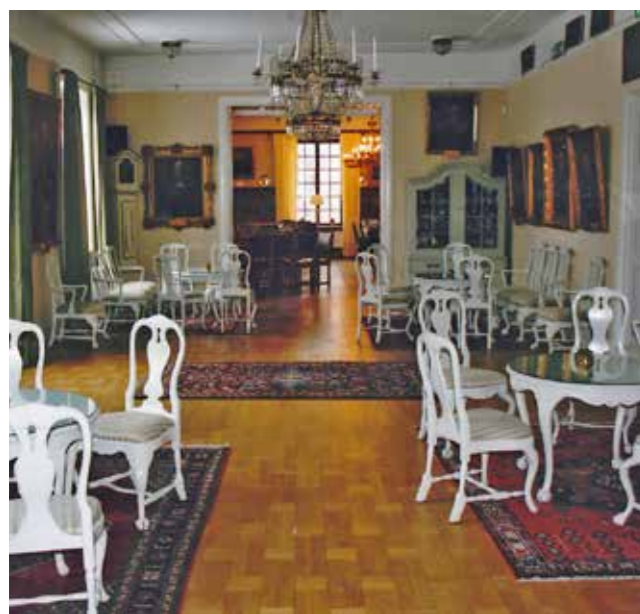
Kamratföreningen i Borås har en mycket charmig mäss, passande för små och stora sällskap