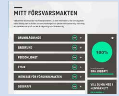
Du får förslag på utbildningar och tjänster utifrån din profil.

Skapa din profil på hemsidan jobb.forsvarsmakten.se/sv/vagen-in/mit-forsvarsmakten/