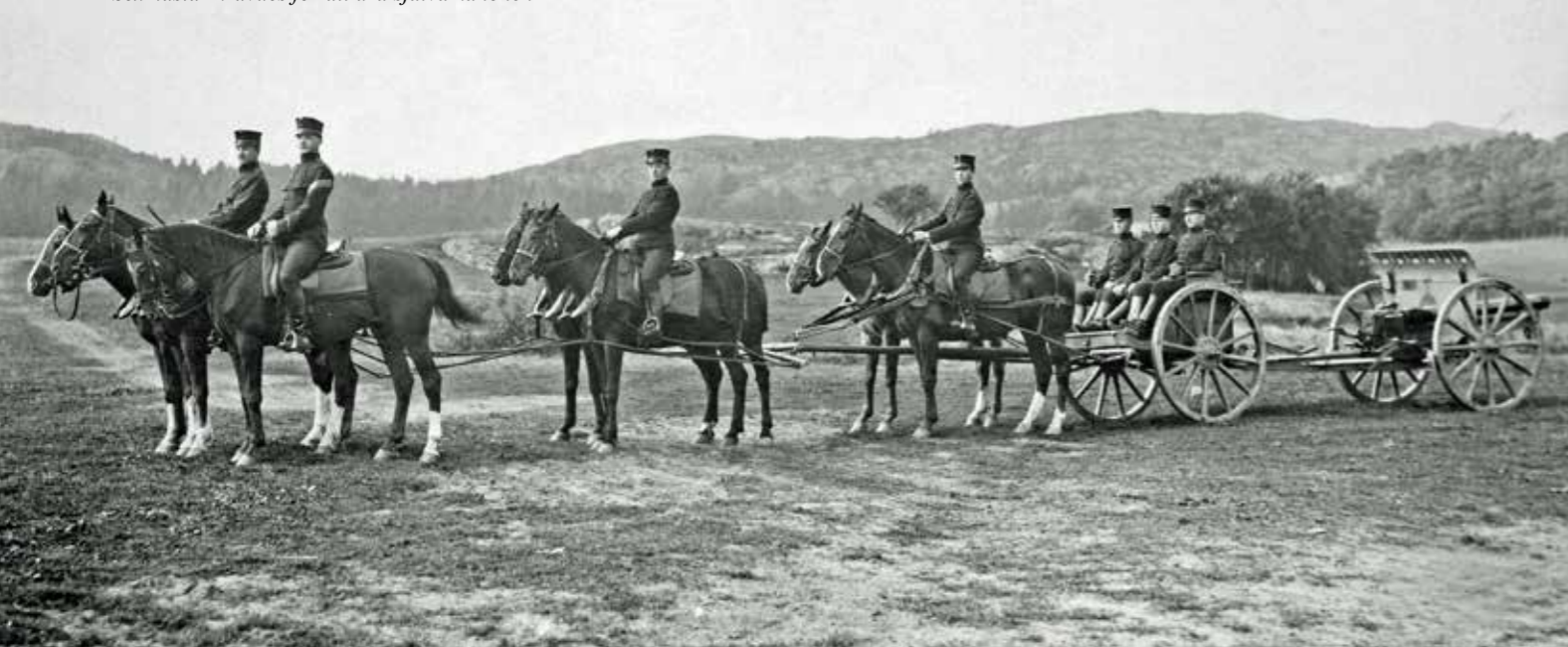
Sex hästar krävdes för att dra själva kanonen